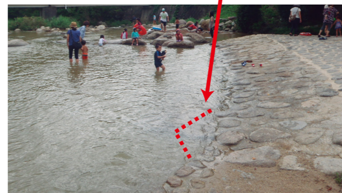
水制工設置後、堆砂傾向となった