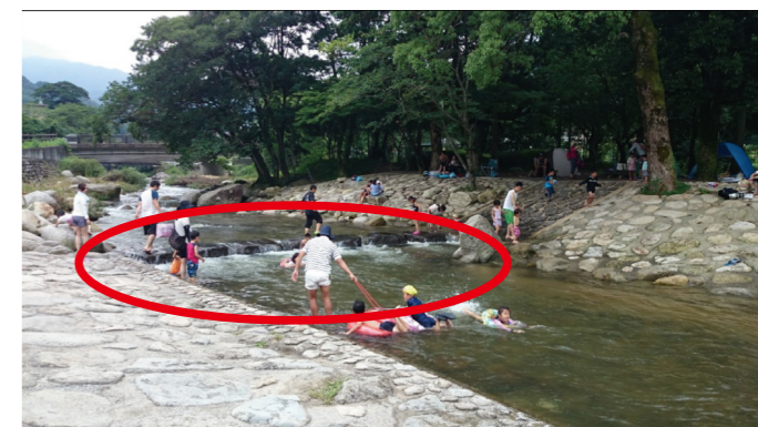
流れが速くなるよう、狭い間隔で飛び石を設置