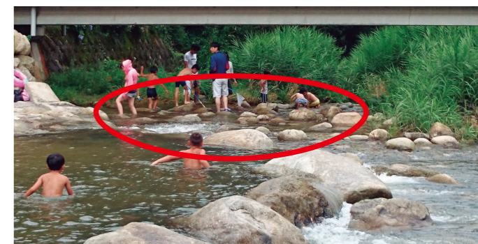
現地の石を無作為に並べ、小魚の隠れ場所を整備