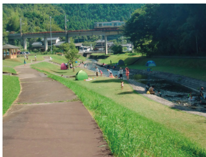
篠栗町が年3回除草・清掃を実施