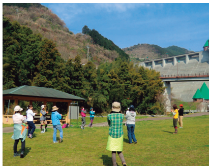
ウォーキングイベント